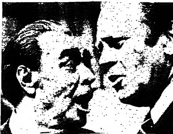
الزعيمان بريجنيف وفورد وجهالوجه في هنسكي

غسار الرئيس الأمريكي نورديج ورئيس السوفييات بريجنيف هنديهما أمس، بعد محادثات مطولة وصعبة، في واشنطن. وقد وافق بريجنيف على إبرام اتفاق مع الرئيس الأمريكي في شأن وقف إطلاق النار في الشرق الأوسط، وإن لم يتم الاتفاق على تفاصيله النهائية في وقت لاحق من المحادثات. كما وافقت على تحديد الإسئلة الاستراتيجية. وقال ستروغ: لقد انفتحت على بعض الحدود التي استقلت إلى الوراء في جيف التوسع في صيفها التالية. ولدى خروج الزعيمين من السفارة في واشنطن، ترقب سفير السوفييات هنري كيسنجر وزير الخارجية الأمريكي هل ستأتي زيارته. وكان كيسنجر قد قال مساء أمس الأول، إن الجهود المبذولة للتفاوض على اتفاق جديد في سبيل تقرب الآن من التفاهة التقنية، وأضاف أن الوضع ليس في حالة بلاسة على الأقل.